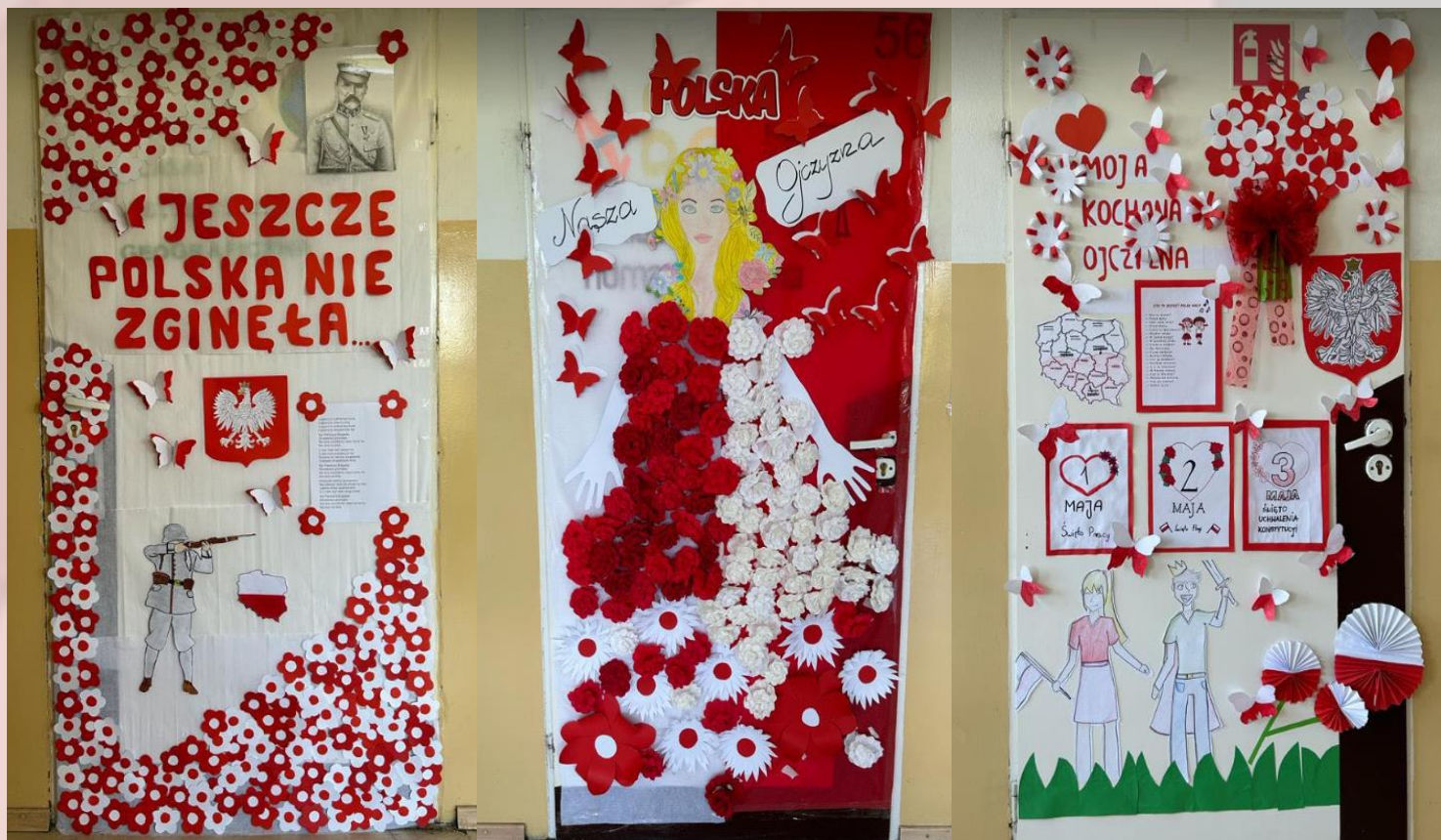
I miejsce Klasa VI

Dnia 8 maja 2023 roku odbył się konkurs na najładniej ozdobione drzwi w stylu patriotycznym. Konkurs został zorganizowany z okazji Świąt majowych tj. Święto Pracy, Dzień Flagi i Konstytucja 3 maja. W konkursie wzięły udział klasy 1-8. Komisja oceniająca składała się z nauczycieli, którzy podczas wizyt w klasach dokładnie obejrzeni i ocenili każde ozdobienie. Kryteria oceny obejmowały zgodność pracy z tematyką konkursu, oryginalne podejście do podjętej tematyki oraz estetykę wykonania pracy. Poniżej przedstawiamy pierwsze, drugie i trzecie miejsce. Na następnej stronie można obejrzeć pozostałe drzwi konkursowe.